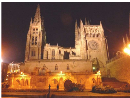
La Cathédrale de Burgos