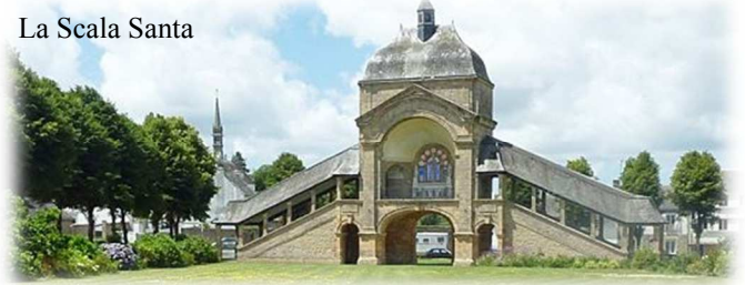
La Scala Santa

Le sanctuaire actuel comprend également la Scala Sancta, (escalier que le pèlerin monte à genoux), une fontaine et un mémorial impressionnant érigé en souvenir de 240.000 bretons tués au cours de la Première Guerre Mondiale.